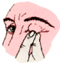
A Levante las pestañas, con sus dedos.

Estos materiales son perjudiciales no sólo por sus efectos irritantes, sino por el peligro de raspar el ojo o introducirse en él.